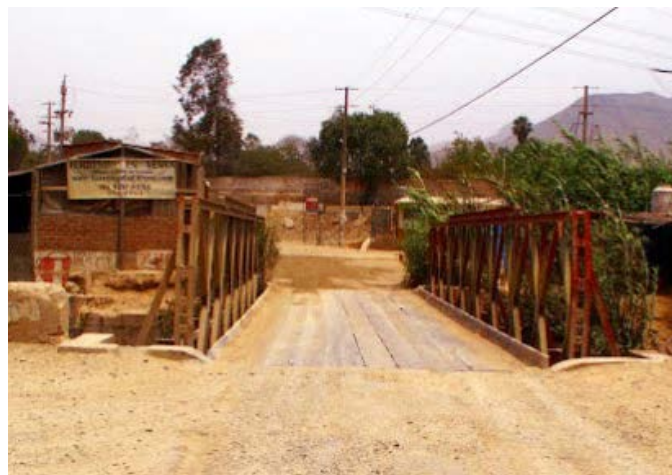
Puente de metal que hay que cruzar en la ruta de verano.